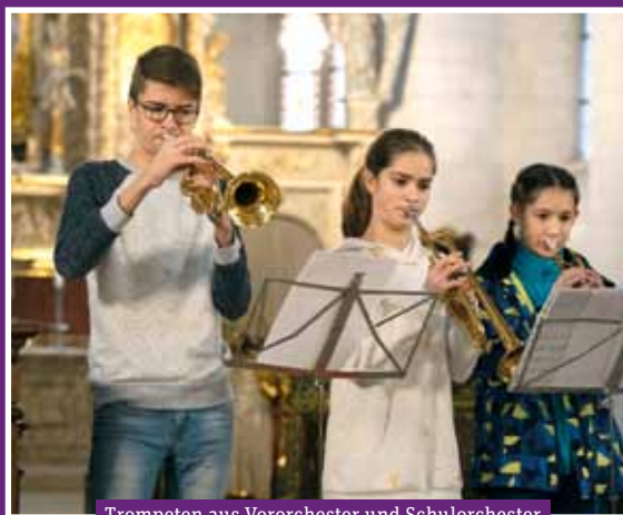
Trompeten aus Vororchester und Schulorchester