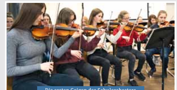
Die ersten Geigen des Schulorchesters