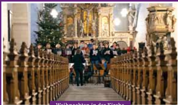
Weihnachten in der Kirche