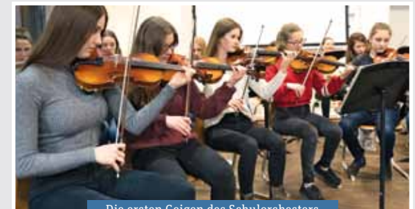
Die ersten Geigen des Schulorchesters