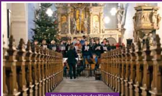
Weihnachten in der Kirche