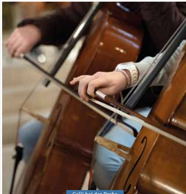
Celli bei der Probe